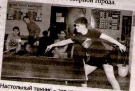
Настольный теннис – это увлекательно.

Этими соревнованиями подведены итоги учебного спортивного года, уточнён состав юношеской сборной города.