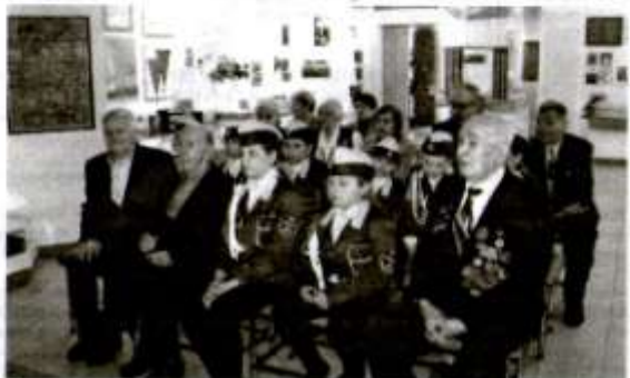
Урок памяти в березниковском музее УДТК.