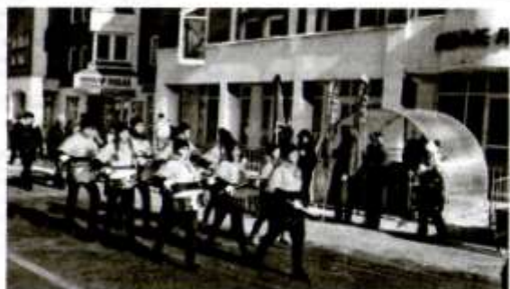
Пермь. Парад памяти 10-го Уральского добровольческого танкового корпуса

художник Олег Табаков часто вспоминал такую историю из своего детства. В начале 1943 г. он увидел, как пленных немцев, всех ободранных, выгружали из вагонов на вокзале. Он, маленький, вместе с бабушкой получил тогда буханку чёрного хлеба с маленьким довеском на всю семью. Пришли домой. Бабушка разрежала этот хлеб на куски, завернула в тряпку и сказала: «Мёлик, иди, отдай людям». Олег онемел, ничего не мог понять: отец его был в окружении на Кавказе, сами недоедали, как же отдать хлеб врагам? Но не стал спорить с бабушкой, молча взял этот хлеб и отвёс пленным немцам. Олег Павлович потом говорил, что на таких жизненных примерах он очень рано узнал, что такое сострадание, доброта и всепрощение. Ещё он вспоминал, как в своём Саратове школьником бежал в госпиталь и выступал перед ранеными. В конце встречи дети задавали вопросы, а закончили её мнутой молчанием.